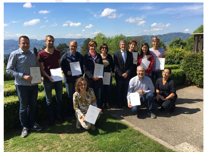
Abb. 3 ▲ Die erfolgreichen Absolventen

ausgewählte Abschnitte besuchen konnten. Die Kursteilnehmenden brachten allesamt verschiedene berufliche Hintergründen mit sich: Anästhesiologie, Innerer Medizin, Psychiatrie, Gynäkologie, Zahnmedizin. So entstand ein interessantes Wechselspiel zwischen aufmerksamem Zu-